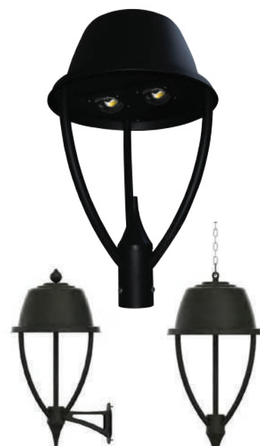
Opción de Sobreponer