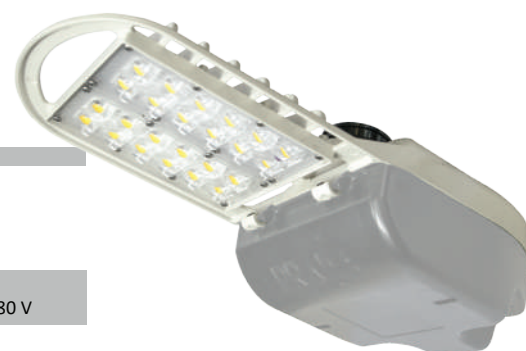
Peso: 2.3 kg Dimensiones (mm):