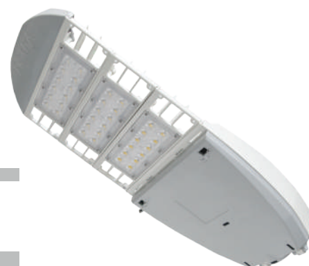
Peso: 4.5 Kg