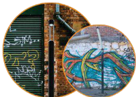
Linea COBALT resistentes ante actos vandálicos Productos no resistentes ante actos vandálicos