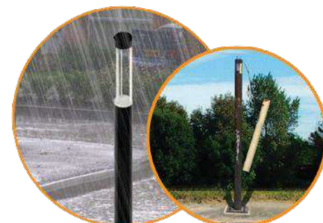
Linea COBALT resistentes al intemperie Productos no aptos para intemperie