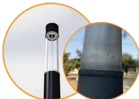
Linea COBALT sin que difusores de plastico degradan con el tiempo Productos con partes degradan con el tiempo