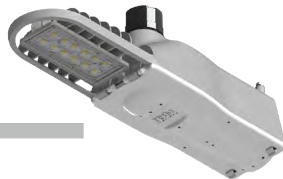
Peso: 3.1 Kg