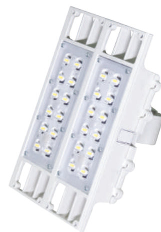
Peso: 4,5 kg