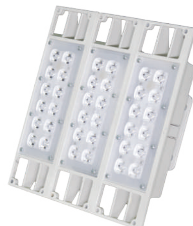
Peso: 5,0 kg