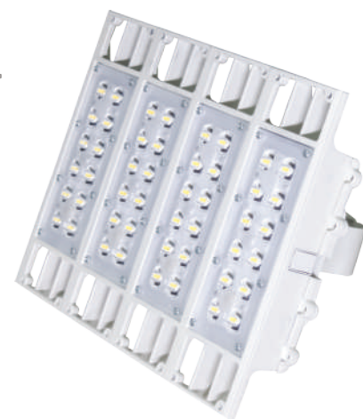
Peso: 5,6 kg

*****Rango de giro 150° en la horizontal, 90° en la vertical