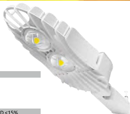
Peso: 8.3 Kg