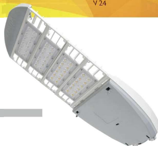
Peso: 4.5 Kg