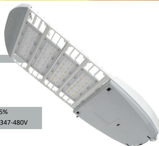
Ajuste de Inclinación interno de +/- 5° a +/- 10°