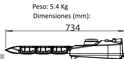
Peso: 5.4 Kg Dimensiones (mm):