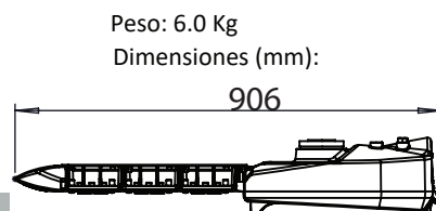
Peso: 6.0 Kg Dimensiones (mm):