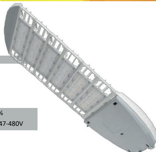
Ajuste de Inclinación interno de +/- 5° a +/- 10°