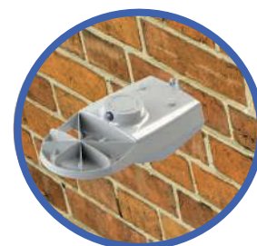
Fijación a muro sin necesidad de accesorios adicionales