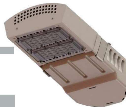
Peso: 5.0 Kg